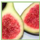
SUCCO DI FRUTTA