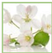
FIORI DI BACH